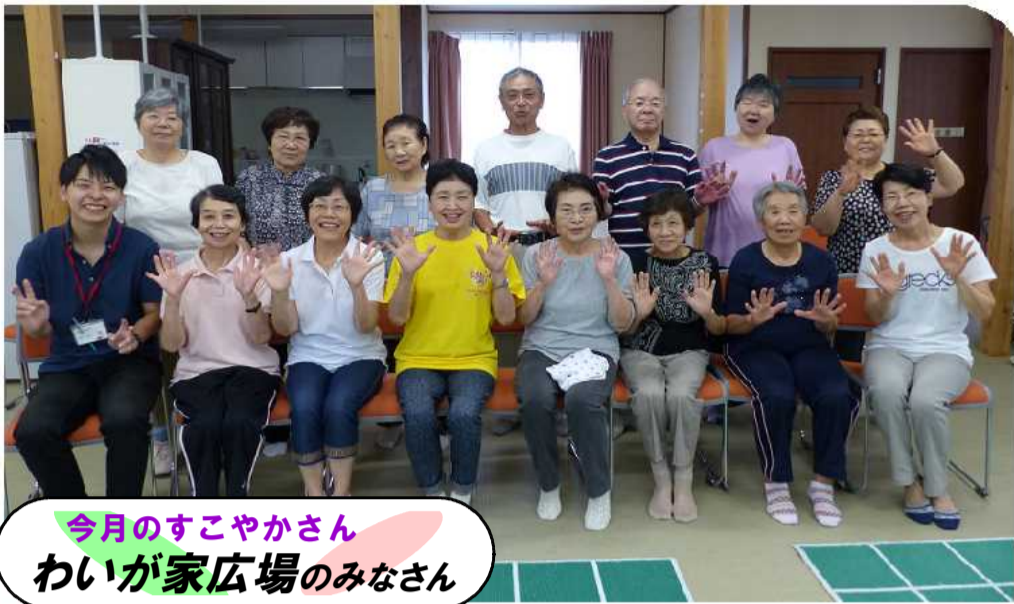
今月のすこやかさん わいが家広場のみなさん

わいが家広場は、毎週土曜日、9時半から地域住民が主体となり、セラバンド体操だけでなくスクエアステップなど様々な介護予防を取り入れた活動をしています。現在四郎丸・豊田・栖吉地域の方30名が登録しています。