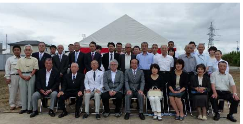
みんなで力を合わせていきましょう

いつまでも自分らしくはつらつと過ごすため「わいが家広場」で一緒に体を動かしませんか？ どなたでも参加できます。