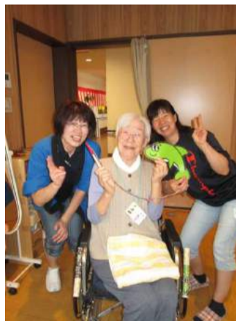
「楽しかったわ、イエーイ」

老健あらかちでは、8月28日にあらかち祭を行いました！お神輿からスタートし、スイカ割り、魚釣り、ひもくじなどで盛り上がりしました。昼食では、デザートバイキングを行い、3種類のデザートから選んでいただきました！ご利用者様の素敵な笑顔を見られたこと、「楽しかった」などのお言葉を貰えたこと、普段よりも沢山ご飯やおやつを召し上がっている方を見ることができ、ご利用者職員共に良い思い出が出来ました♪