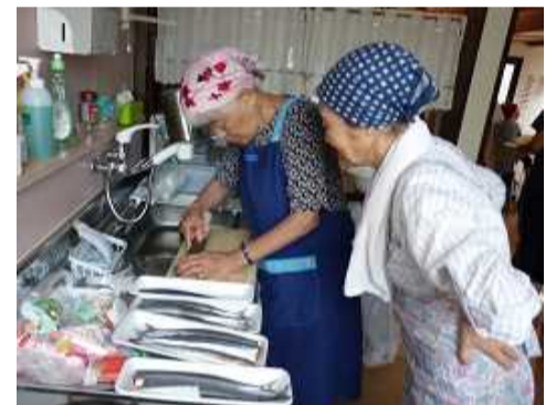
「私は、はらわた取って食べるの」

9月16日(金)らくていぶご利用者さんと職員合わせて10名で手作り敬老会をしました。この日のメニューはサツマイモご飯・サンマ塩焼き・茶碗蒸しなど7品。材料の買い出しから調理まで全て自分たちで行い、秋の味覚を存分に堪能しました。「料亭の味ね」「楽しい」「単なるお遊びじゃないのがいい」とご利用者さんに好評でした。昼食後はバイオリン生演奏を聞き、芸術の秋も楽しみました。