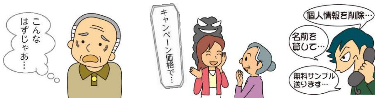
イラスト:消費者庁イラスト集より