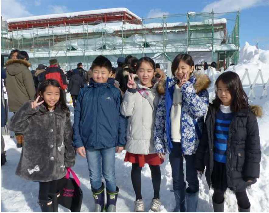
生協なごかデンタルクリニック 上棟式にて