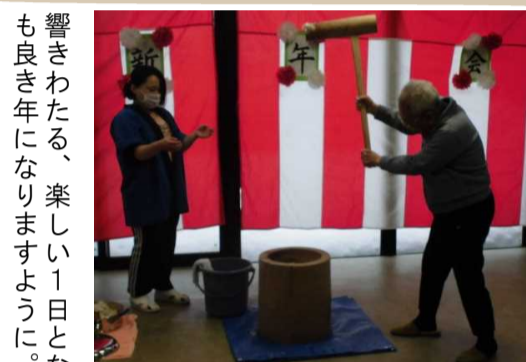
アシスト笹崎 餅つき大会

1月17日、アシスト笹崎で新年会を行いました。午前中は福笑い・カルタを楽しみ、午後は毎年恒例の餅つき大会を行いました。大きな笑い声が響きわたる、楽しい1日となりました。