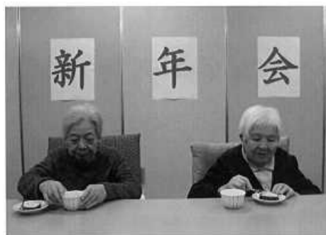
新年会で 伊達巻き作り フラット高町 小林

フラット高町では、伊達巻き作りと福笑いをしました。福笑いをしつづつ、伊達巻き作りも、伊達巻きの方が気になる様子でした。はんぺんを使った調理に皆様協力して下さり、上手に出来、味も大好評でした。