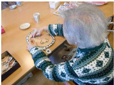
アシスト高町・小黒

フラット高町では、伊達巻き作りと福笑いをしました。福笑いをしつづつ、伊達巻き作りも、伊達巻きの方が気になる様子でした。はんぺんを使った調理に皆様協力して下さり、上手に出来、味も大好評でした。