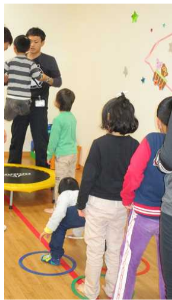
連絡先 316555 みんなで楽しく きらきらタイム