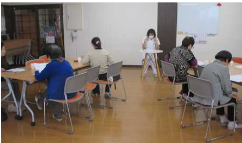
10/28 この日は感染症予防講話