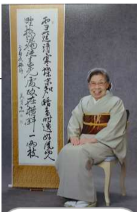
← 昨年のお出かけは、着物での記念撮影。

私は生まれも育ちも長岡です。ここ(アシスト笹崎)には平成24年からお世話になっております。住み心地がよく、日当たりがいいお部屋ですよ。その前は老健あらまちにおりました。一日一日が勝負で、かされていくという感じがします。食事はいろいろ制限がありますが、食べられないものがあります。先日のお出掛けでは、SOGOも見えてきました。長岡駅がなんに変わっていったのか、関連記事右下