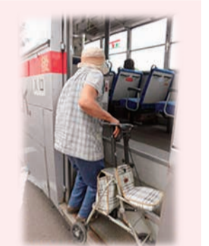
♪ 療法士の見守りでシルバーカーを持ってバスの乗り降りの練習をしています。