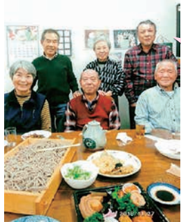
忘年会は手作り蕎麦で 食事会でした。