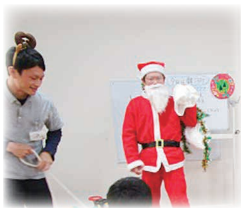
銀河では、昨年クリスマス会を企画して、利用児さんたちに大好評でした。

現在 登録41名(男児27名 女児14名) 平均年齢10歳2か月 この事業は、小学生から高校生までの受入れを行っており、ダウン症に代表される染色体異常や、自閉スペクトラム症など特別な配慮が必要な児童の受入れを行っております。地域の需要の高い福祉サービスで、開設から10ヶ月で稼働率は100%を超える状況となり、以後平均115%ほどの稼働を続けております。いかに、地域から必要とされているサービスであるかお分かり頂けると幸いです。長岡市内には、