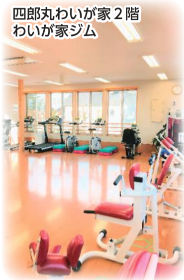
四郎丸わいが家2階 わいが家ジム