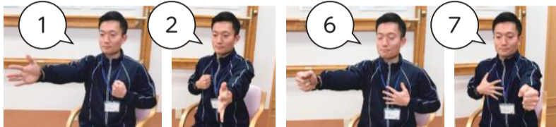
1 前の手がパー、胸の手がグーで 1, 2, 3, 4, 5と数えながら 左右の手を入れ替える