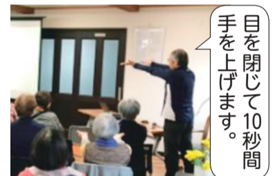
目を閉じて10秒間 手を上げます。

《他のアンケート項目》 ●講座の総合評価平均93点 (100点満点) ●今後取り上げてほしいテーマ 最多は「認知症」次いで「関節痛」 「栄養」という結果でした。 ★途中の休憩時間でおこなった運動ト レーナーによる体操も良かったと好 評でした。 ★総合評価も高く、満足度の高さがう かがえました。