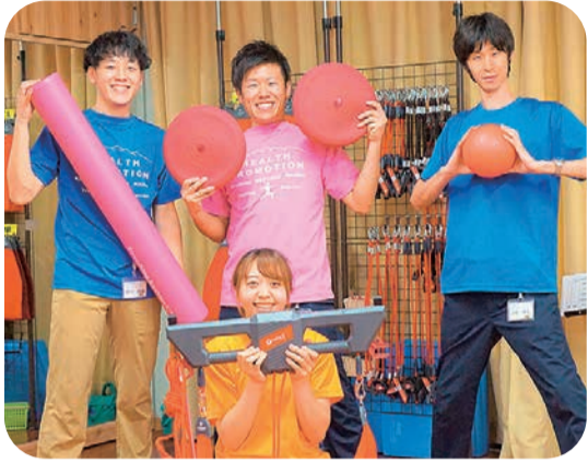
かんだりハビリティトレーナーより

そんな皆様のカラダに少しでも良い影響を与えられればと思います、この度かんだりハビリティトレーナーがYouTubeにてご自宅で簡単にできるエクササイズ動画の配信を始めました。カラダの調子を整え、効率良く・機能的にカラダが動けるようになるために、様々な目的に応じたエクササイズを詳しい解説を交えて紹介いたします。週1回のペースで新しいエクササイズを投稿、更新していきます。自宅での運動にぜひご活用下さい!